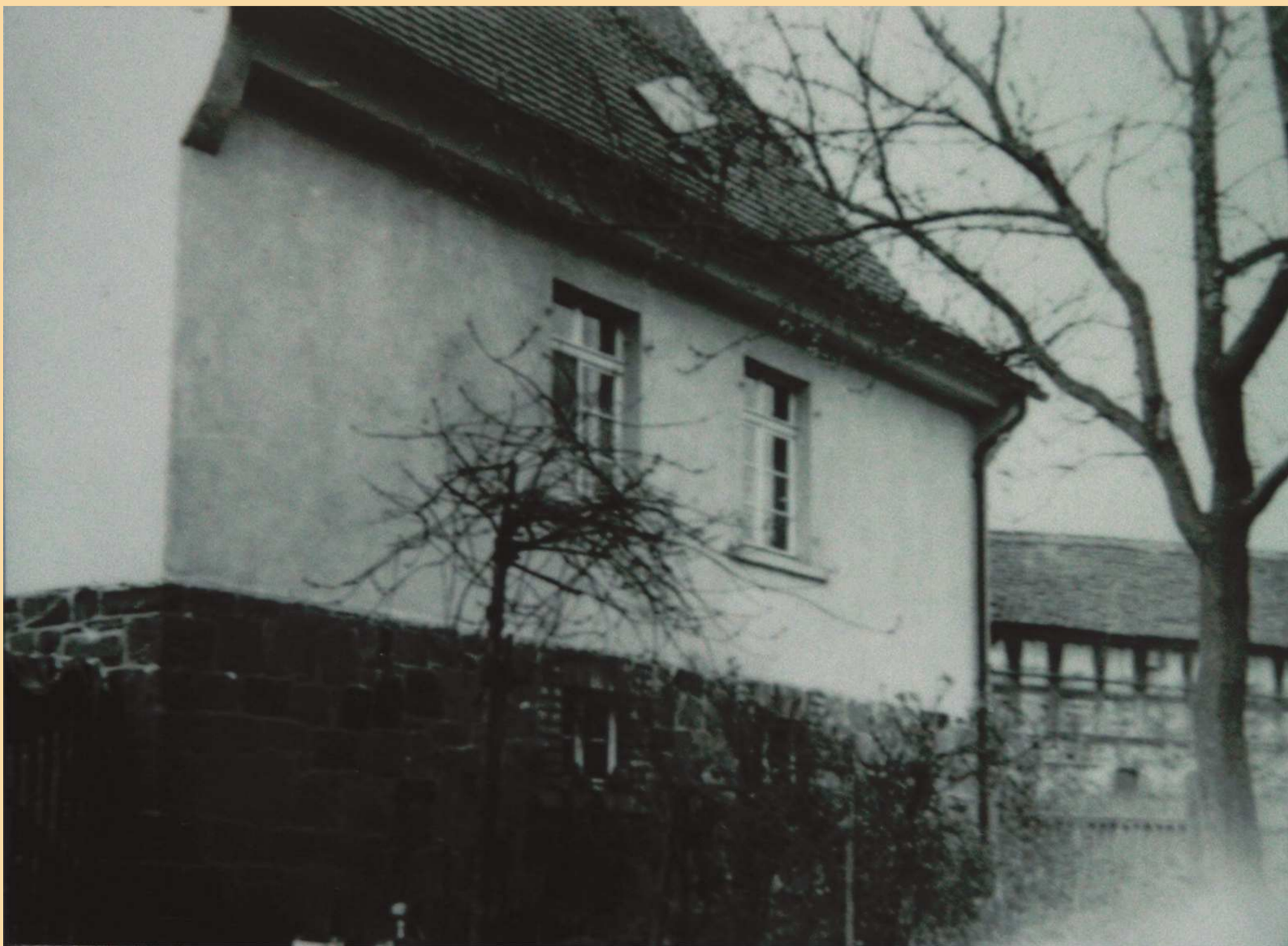
Unter der Linde 1

Am 6. September 1942 wurden sie nach Theresienstadt deportiert und 1943, bzw. 1944 nach Auschwitz. Sie haben nicht überlebt.